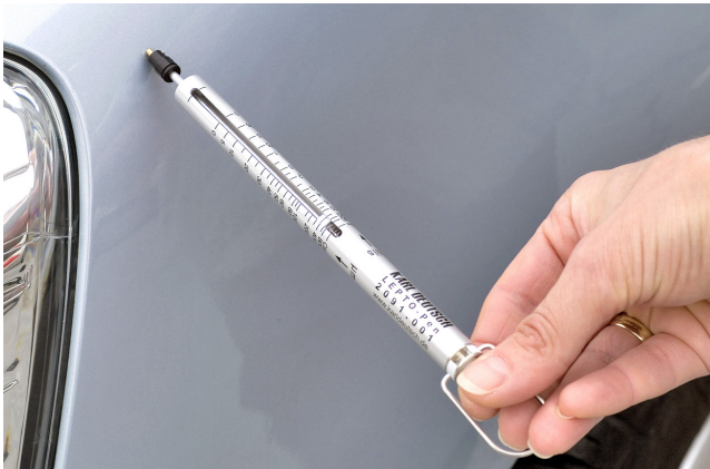
Dickenmessung an einer Fahrzeug-Lackschicht (Anwendungsbeispiel)