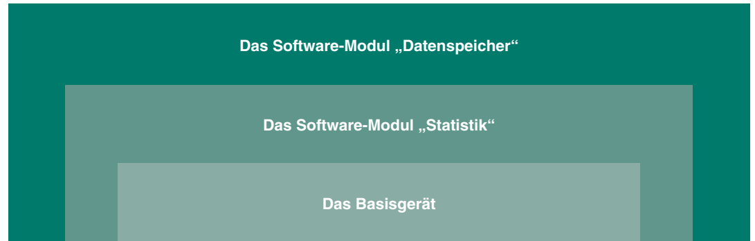
Das aufeinander aufbauende Stufensystem des neuen LEPTOSKOP 2042

Für alle Geräte passend ist eine große Auswahl an austauschbaren Sonden erhältlich. Alle KARL DEUTSCH-Sonden sind „Aktive Sonden“ mit eingebautem Mikroprozessor und Signalaufbereitung. Diese erreichen höchste Mess- und Wiederholgenauigkeit und machen das LEPTOSKOP 2042 zum zuverlässigen Partner für alle Messaufgaben.