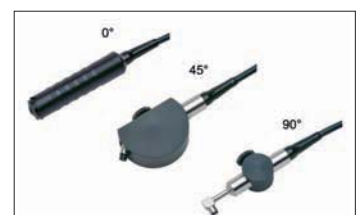
Positionierhilfen für Mikrosonden