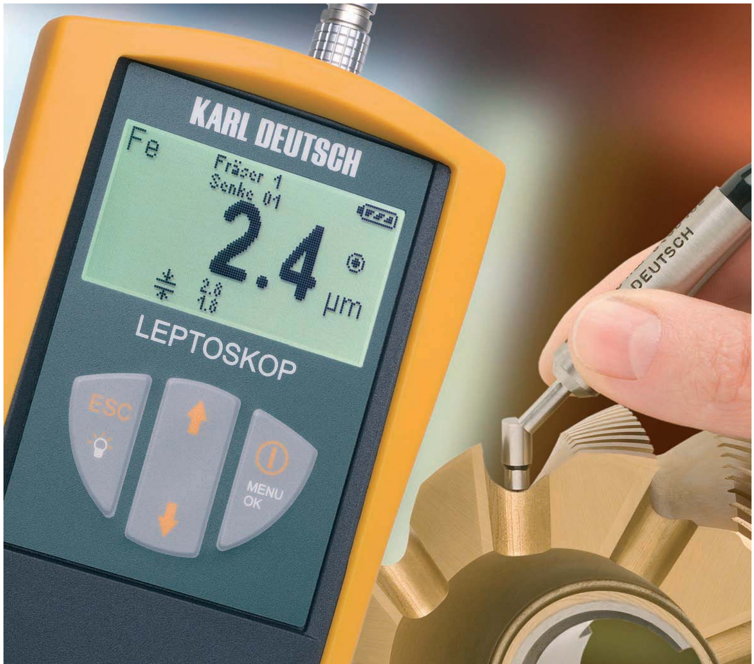
LEPTOSKOP® 2042 Schichtdickenmessung