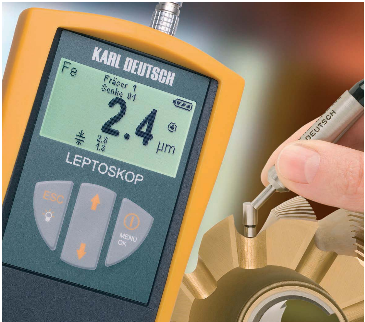
LEPTOSKOP® 2042 Schichtdickenmessung