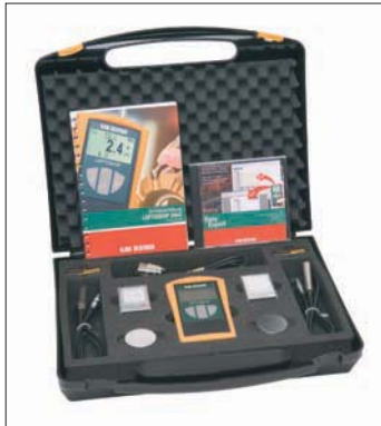
Praktischer Transportkoffer bietet Platz für umfangreiches Zubehör

Der Markenname LEPTOSKOP® steht für jahrzehntelange Erfahrung in der Entwicklung von präzisen und zuverlässigen Schichtdickenmessgeräten aus dem Hause KARL DEUTSCH.