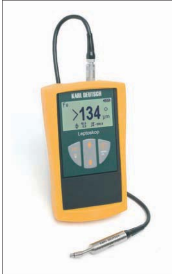
Das LEPTOSKOP 2042: Leistungsstark, modern, günstig