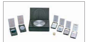
Kalibrierfolien-Set und Kontrollkörper