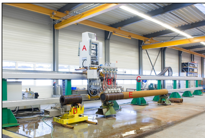
Ansicht des Prüfportals im Hause KARL DEUTSCH vor der Lieferung: A = Prüfelektronik, B = Prüfkopfhalter, C = Prüfportal, D = Kalibrierstation, und E = Rohr aus der Produktion.

Die Entwicklung und Montage des Prüfportals erfolgte vollständig im Hause KARL DEUTSCH in Wuppertal. Um den Installationsaufwand der Anlage beim Kunden zu minimieren, wurde das Prüfportal noch vor dem Transport umfangreich getestet. Die Gesamtlänge der Anlage beträgt etwa 25 m. Auf den Bildern ist ein kurzes Rohrsegment (800 mm) und ein langes Rohr aus der Produktion (6m) zu erkennen. In beiden Rohren wurden künstliche Fehler eingebracht. Das kurze Rohrsegment wird für die dynamische Empfindlichkeitsjustierung des Prüfsystems bei voller Prüfgeschwindigkeit genutzt. Mit Hilfe des langen Rohres wird danach die Justierung überprüft.