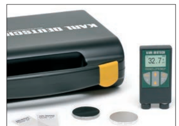
Pocket-LEPTOSKOP mit Zubehör