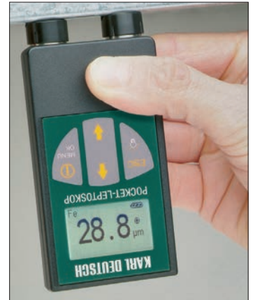
Drehbares Display: auch bei Überkopfanwendung gut lesbar