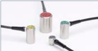
Für jede Messaufgabe: Die Prüfköpfe des ECHOMETER 1076 TC