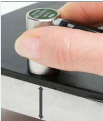
Messung auch durch die Beschichtung