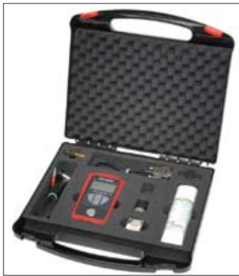
Lieferung im handlichen Transportkoffer